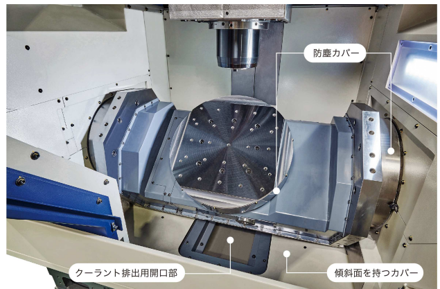
装着する円テーブル駆動部に防塵カバーを設置

以上のように脆性材加工で求められる仕様に対応すべく開発・販売した機械ですので、是非とも多くのユーザー様にてご検討をお願い致します。