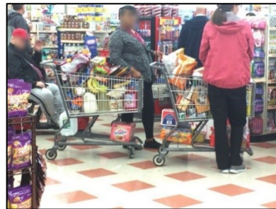
・スーパーのレジにて

アメリカ人は、休日には大量の買い物をします。後方駐車では大量の購入品が積みにくくなるので前向き駐車しています。