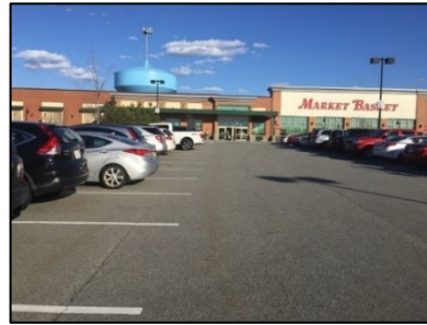
・スーパーの駐車場にて

アメリカでスーパーマーケット等に駐車をするとみんなが駐車スペースに車を頭から突っ込ませて駐車している光景をよく見ます。実はいくつか理由があるそうです。