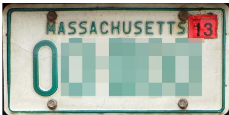
・緑のナンバープレート

パトカーが巡回確認しやすいように、ナンバープレートが付いている後ろを見せる為という話を聞いた事があります。この説は信憑性が低いですが！